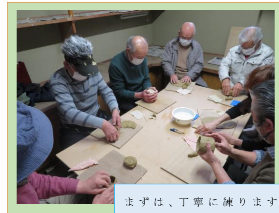
まずは、丁寧に練ります。