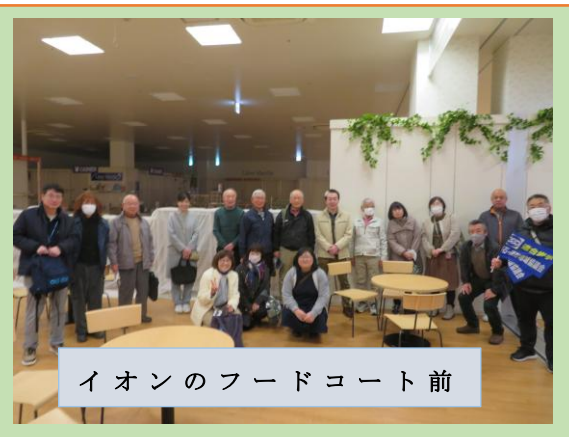
イオンのフードコート前

10月25日(土)に「2025健康ウォークラリー」が連合岩手釜石地域協議会事務所をスタートに開催されました。6人の参加がありました。当初は、日向ダム周辺のチエックポイントをめぐる約8キロの歩行予定でしたが、熊松倉駅、県立釜石高校付近などを歩く約5キロのコースに変更になりました。各設置ポイントをめざして、黙々と、時に談笑しながらのウォーキングになりました。今回、残念ながら、日向ダム付近の紅葉を見ることはできませんでしたが、健康を考える良い機会になりました。その後、完歩者に対して、大抽選会を行い、健康グッズを手に入れました。次回の多数の参加をお待ちしております。