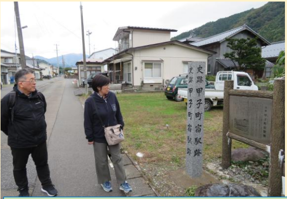
甲子の宿場町跡。歴史の学習にもなります。