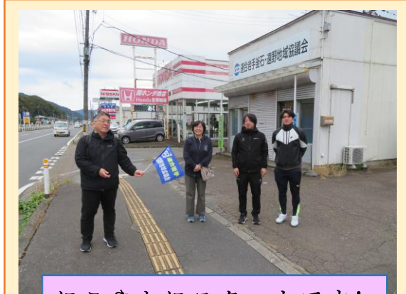
にこやかにスタートです!