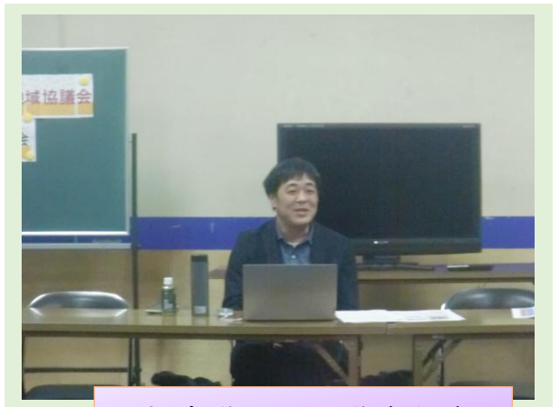
小松市議による議会報告