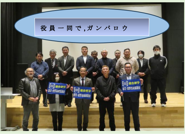
役員一同で、ガンパロウ