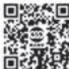
公式ホームページ (HP) の 二次元コード