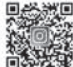
インスタグラム公式 アカウントの 二次元コード