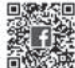
フェイスブック (FB) 公式アカウントの 二次元コード