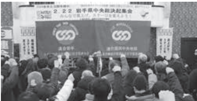
春闘勝利に向けて 団結ガンバロー