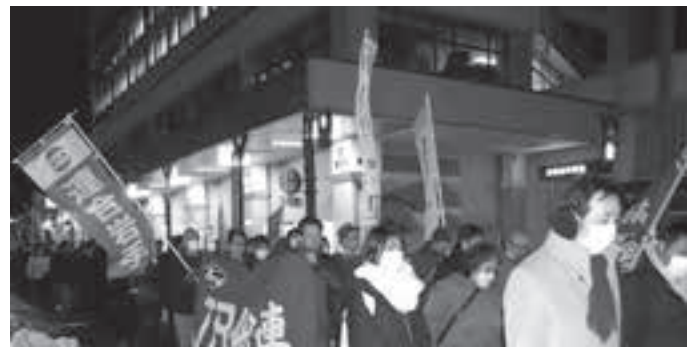
未来づくり春闘・春闘要求実現に向けてデモ行進 (盛岡市)