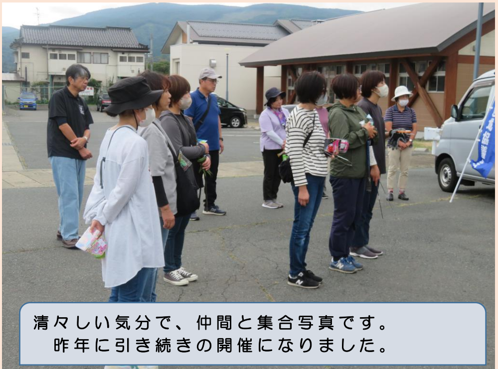
清々しい気分で、仲間と集合写真です。 昨年に引き続きの開催になりました。

連合岩手釜石・遠野地 域協議会(小島安友議長) は、10月1日に「20 23 クリーンキャンペーン In 遠野」を開催しまし た。今年の5月に釜石地 区で実施した「2023 クリーンキャンペーン In 釜石(尾崎半島の植樹)」 に引き続きいた行事にな りました。遠野地区では、 加盟団体の組合員及びそ の家族約二十人が、遠野 中学校を出発し、国道2 83号線遠野バイパスの 歩道を東西2つの班に分 かれて、清々しい風が吹 く秋の遠野路のごみ拾い を行いました。