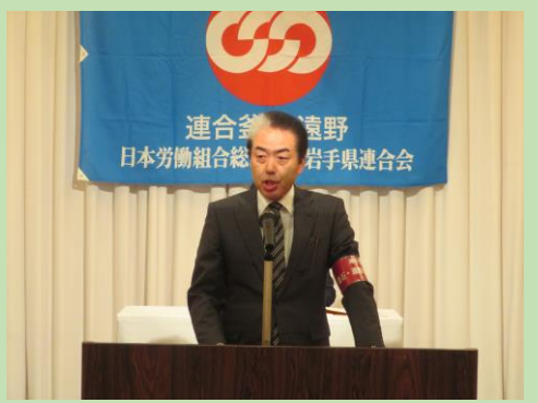
小島議長からの決意の挨拶