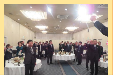
大会終了後の久しぶりの交流会

ともに歩もう、ともに変えよう 仲間の輪を広げ安心社会を!! 第35回釜石・遠野地協定期大会開催