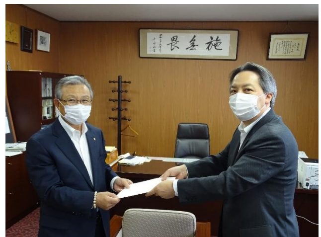
金ケ崎町への連合緊急要請