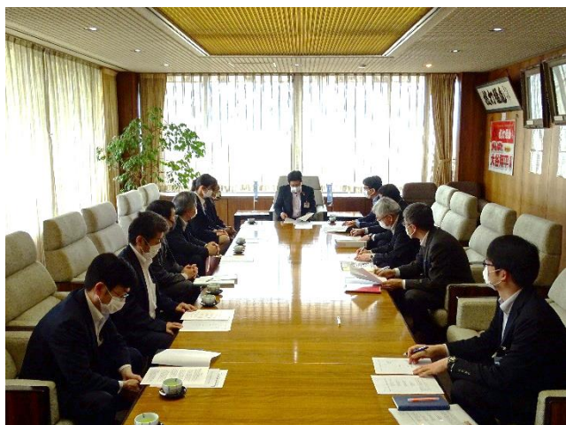
奥州市へのタクシー要請