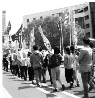
今年は 2 コースのデモ行進