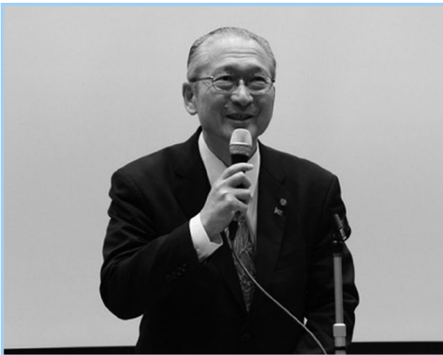
主催者あいさつをする神津会長