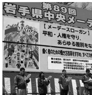
青年委員会朗読劇