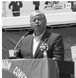
砂金本部長のあいさつ