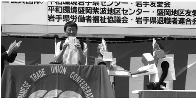
コンクール最優秀賞は JR 総連