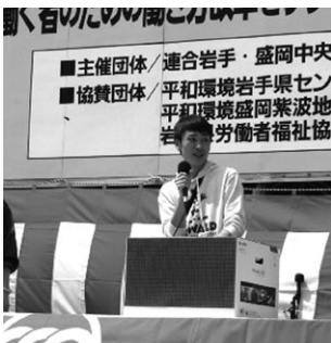
1等 は スチームオープンレンジ