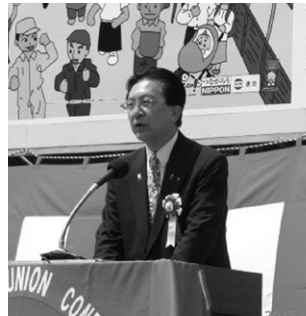
達増知事のあいさつ