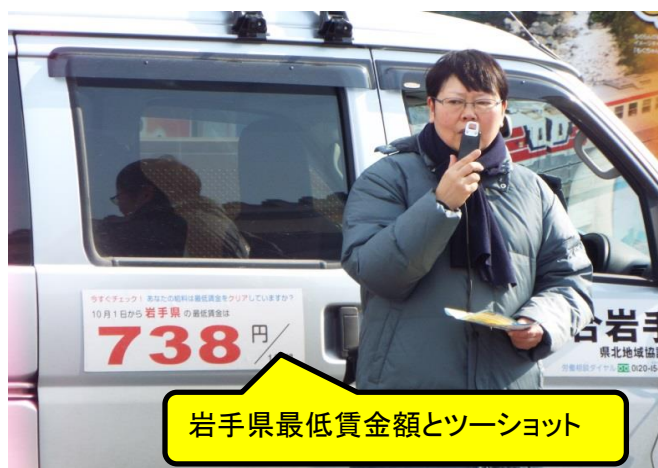
岩手県最低賃金額とツーショット