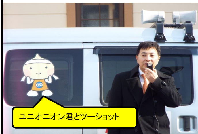
ユニオニオン君とツーショット