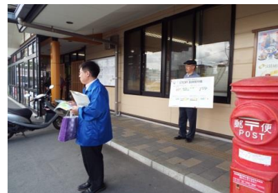
アンケート対象者を探してます(^-^)