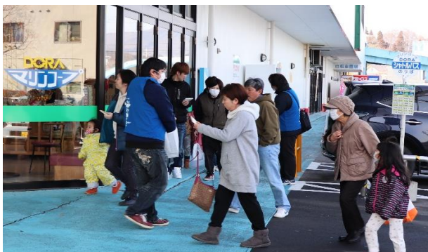
ティッシュ配布活動実行中！ 500個！！

宮古市職労、JP労組宮古支部、東北電労宮古支部、高教組宮古支部、JR東労組宮古連合分会、林野労組三陸北部分会、日作労組、足立労組、三陸生コン支部の方々でした。 <m(_)_m>