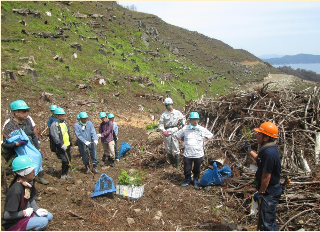
2018年6月に行った尾崎半島への植林。2020年は連合岩手30周年記念事業として取り組む。