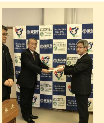
昨年は右・釜石市長、左・大槌町副町長に要請。

2019年は「地域フォーラム2019」「ワールドカップ2019 JAPAN」を迎える年