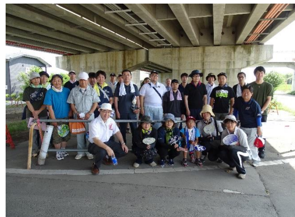
江刺コース参加者