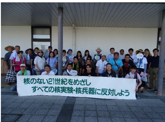
金ヶ崎コース参加者